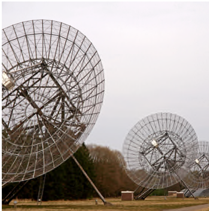
Radiotelescoop Westerbork

De Westerbork-telescoop geldt nog steeds als één van de gevoeligste radiotelescopen ter wereld. Inmiddels heeft huidig eigenaar Astron in de buurt van Buinen en Borger met het Lofar-project de volgende generatie vele malen gevoeliger radiotelescopen gerealiseerd.