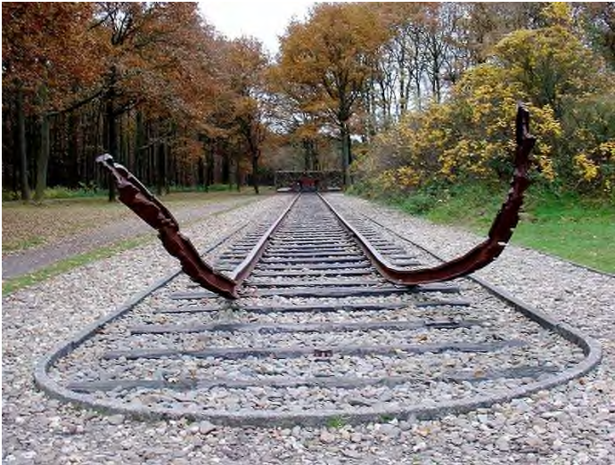
Nationaal monument Westerbork

Het verhaal van Kamp Westerbork begon vlak voor de Tweede Wereldoorlog. Staatsbosbeheer had dit eenzame heideterrein van in totaal 200 hectare beschikbaar gesteld om joodse asielzoekers uit Duitsland op te vangen. De bouw van het Centraal Vluchtelingenkamp Westerbork begon in juli 1939. De regering had er bij de initiatiefnemers op aangedrongen de barakken niet té mooi te maken om te voorkomen dat deze te zeer zou afsteken bij die van de bewoners van deze arme streek... In juli 1942 veranderde de bestemming in Polizeiliches Durchgangslager Westerbork. Meer dan honderdduizend joden en enkele honderden zigeuners verbleven er voor ze op transport gesteld werden naar de gaskamers van Auschwitz en Sobibor. Na de oorlog was het kamp korte tijd in gebruik als interneringskamp voor NSB'ers. Van 1951 tot 1971 deed Kamp Schattenberg dienst als woonoord voor een grote groep Zuid-Molukkers. Er woonden begin jaren zestig zo'n 2000 mensen in dit 'Molukse dorp op de Drentse hei'. Eind jaren zestig verhuisden de Molukkers naar nieuwe woonwijken elders. Kijk voor meer informatie over Herinneringscentrum Kamp Westerbork op www.kampwesterbork.nl .