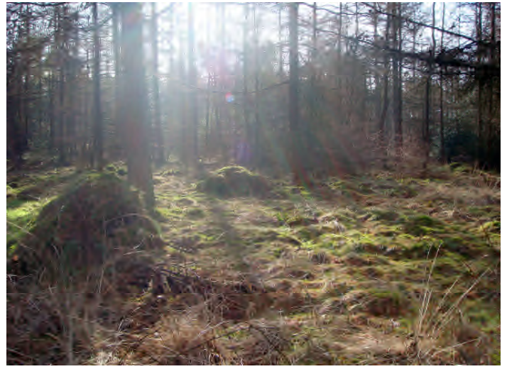
Bos Hooghalen